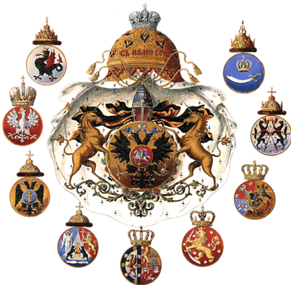
Большой герб Их Императорских Высочеств Великих князей внуков Императора (детей младших Его сыновей)

Большой герб Их Высочеств и их Светлостей тот же, что и герб правнуков Государя Императора, но