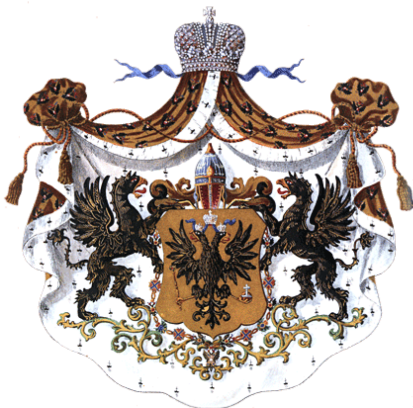
Большой герб Их Высочеств Князей крови Императорской сыновей праправнуков Императора и их нисходящих в мужском поколении щитодержателями служат золотые грифы с красными глазами и языками.