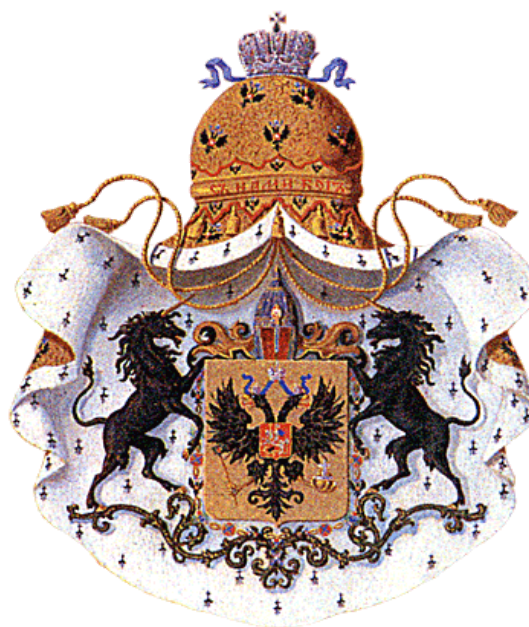
Большой герб Их Высочеств Князей Крови Императорской правнуков Императора