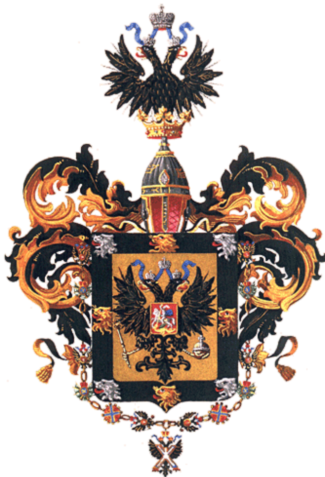
Малый герб Их Императорских Высочеств Великих князей праправнуков Императора